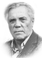
Виктор Петрович Астафьев (1924–2001)

Виктор Астафьев родился в селе Овсянка Красноярского края, на берегу Енисея. Детство писатель провёл с бабушкой и дедушкой. Это время оставило в памяти писателя много светлых воспоминаний. В 1942 году он ушёл добровольцем на фронт. После войны пробовал себя в разных профессиях и занимался литературой.